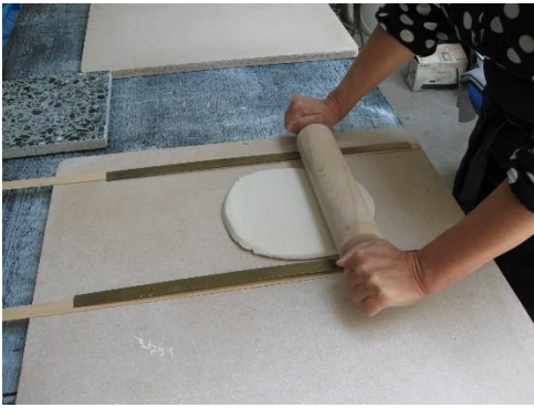
Porcelænet rulles ud i tynde plader.

Alt laves i hånden uden forme. Derfor er der små forskelligheder i de enkelte produkter, og hver ting bliver unik.