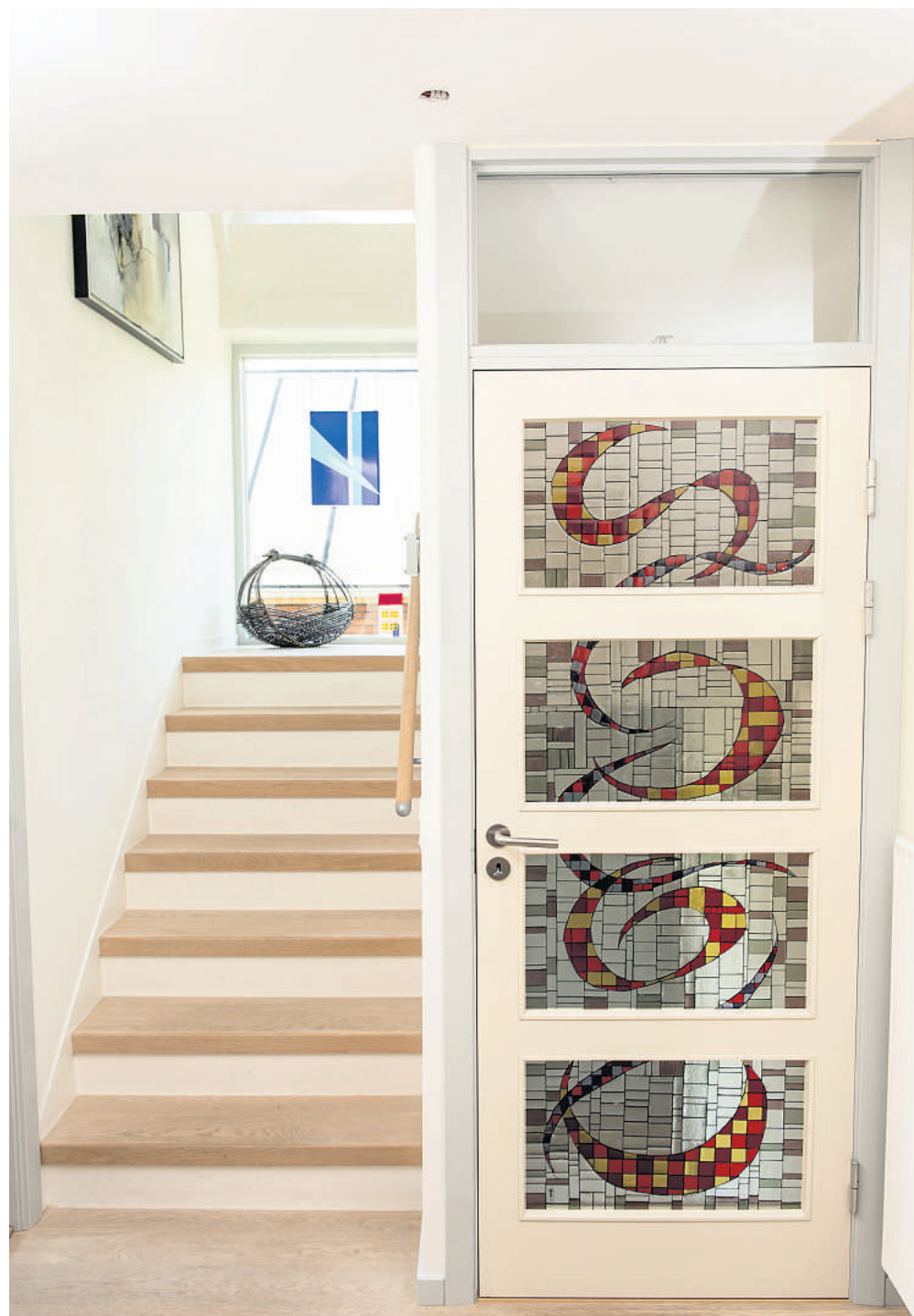
Opgangen i villaen er i dag lys og åben. Tidligere, da huset var en tofamilies villa, var den mørk og tung med terrazzotrappe og jerngelænder.