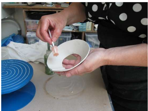
Udsnit samles med slikker (vandig porcelæn)