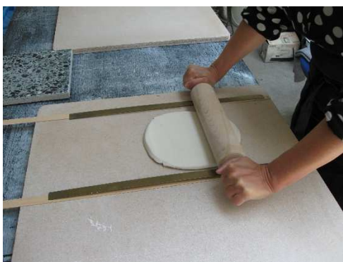
Porcelænet rulles ud i tynde plader.

Alt laves i hånden uden forme. Derfor er der små forskelligheder i de enkelte produkter, og hver ting bliver unik.