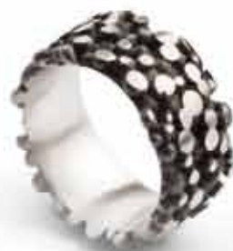
VOLCANO ring i oxyderet 925 sølv. Pris 2.250,-