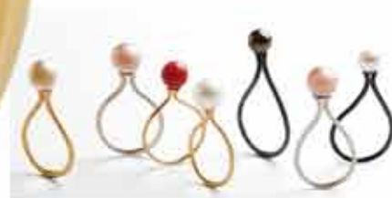
18 karat med 18 karat guld-kugle: 5.500,- Med kundens eget guld til kuglen: 4.000,- Oxyderet sølv med 18 karat guld-kugle: 3.850,- Med kundens eget guld til kuglen: 2.300,-