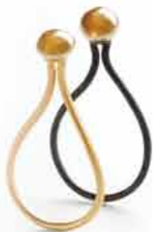
GRACE ringe i 18 karat guld og 925 oxyderet sølv.