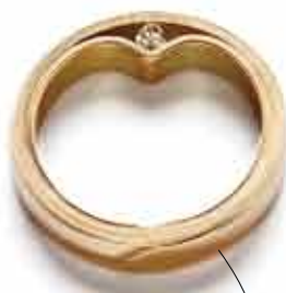
Pyry Tamminen SHEETS. Fingerring, der skjuler diamanten som ærten under madrasserne.

TIRSDAG. Fingerring med rør, hvor diamanten glider fra side til side. TIRSDAG KL. 15: Oxyderet 925 sølvring med kanalfatning.