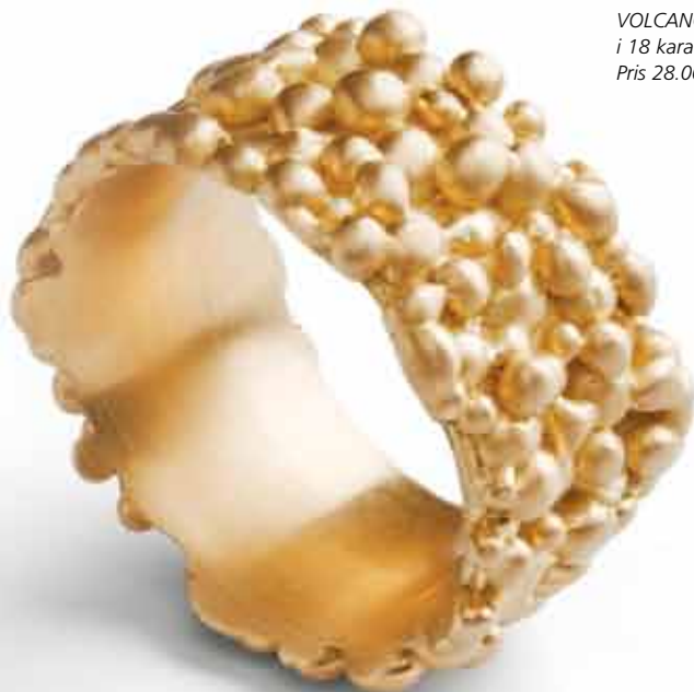
VOLCANO ring i 18 karat guld. Pris 28.000,-