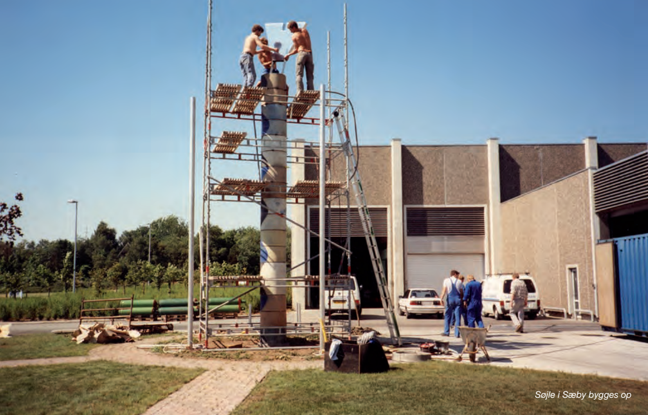
Søjle i Sæby bygges op