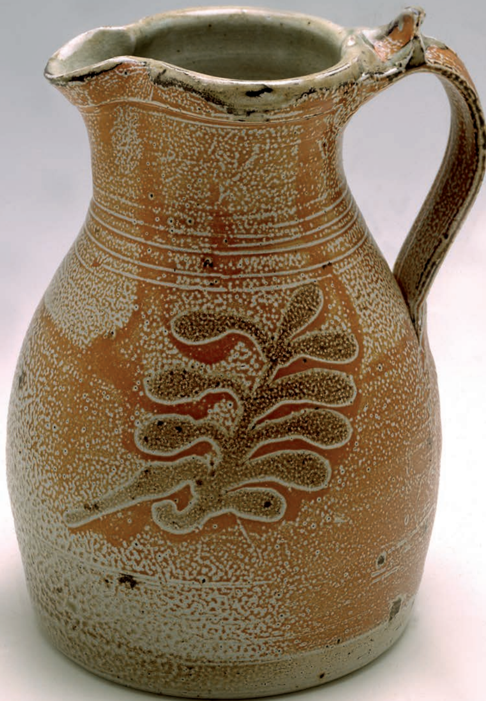
Kander og anti-kander og den første postejform