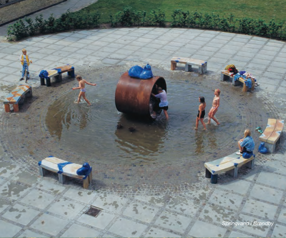
Springvand i Brøndby