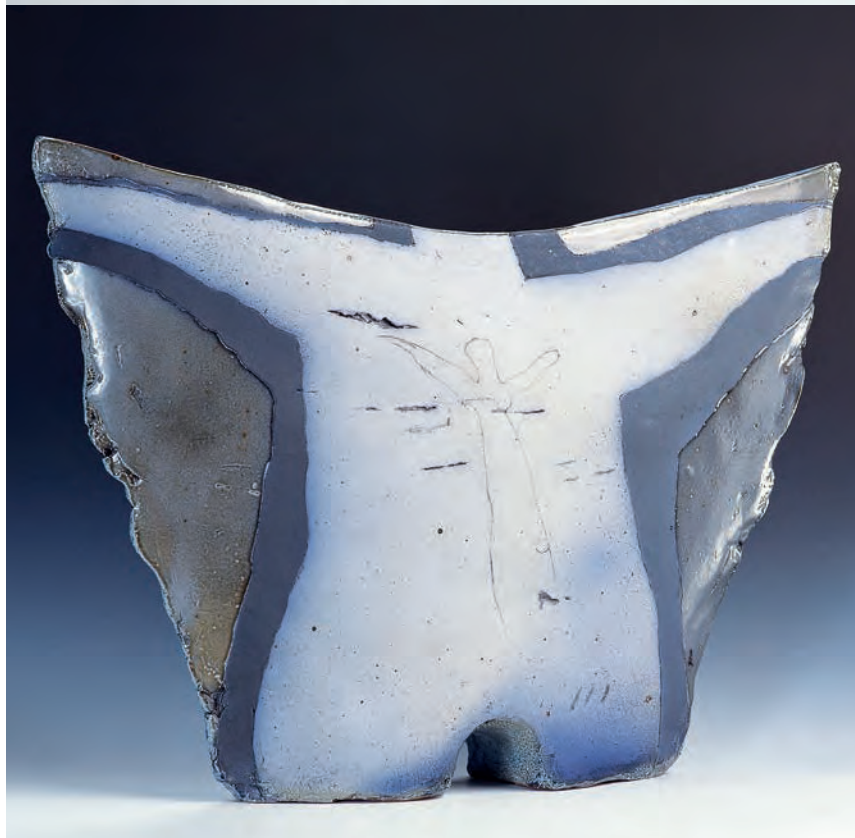
"Tænkeren" h. 45 cm "Frelseren" h. 65 cm