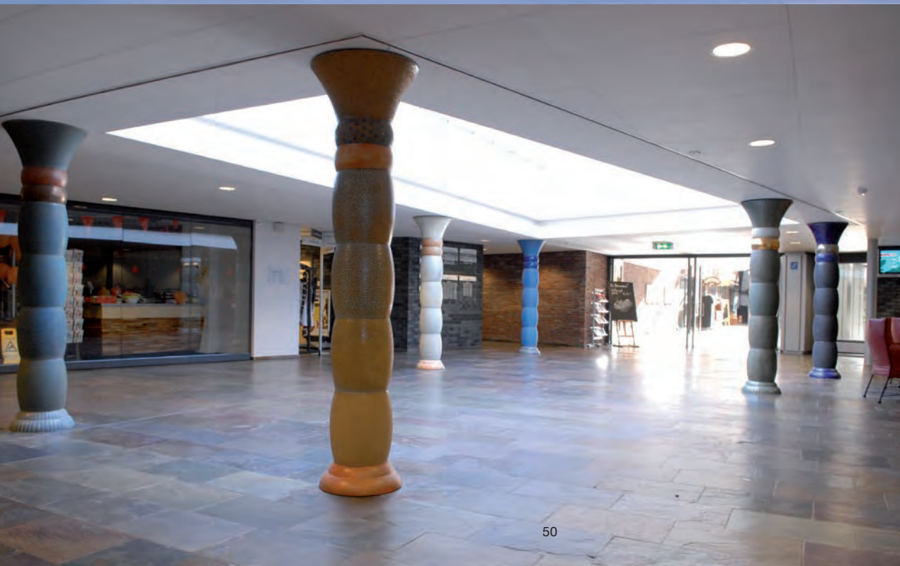
Søjler fra Dianalund, Vlissingen Holland og Ringsted