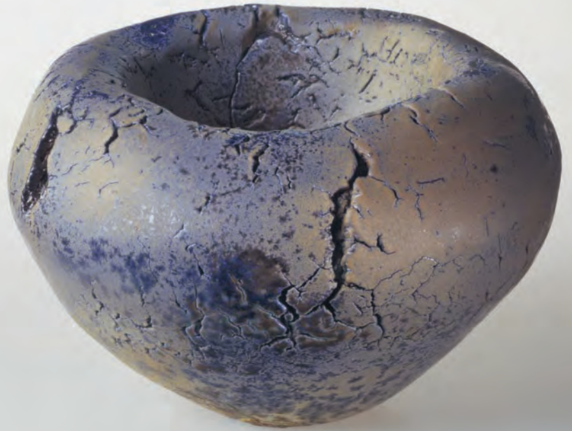
Vi begynder at arbejde med saltglasur. Form d. 25 cm og "lystige koner"