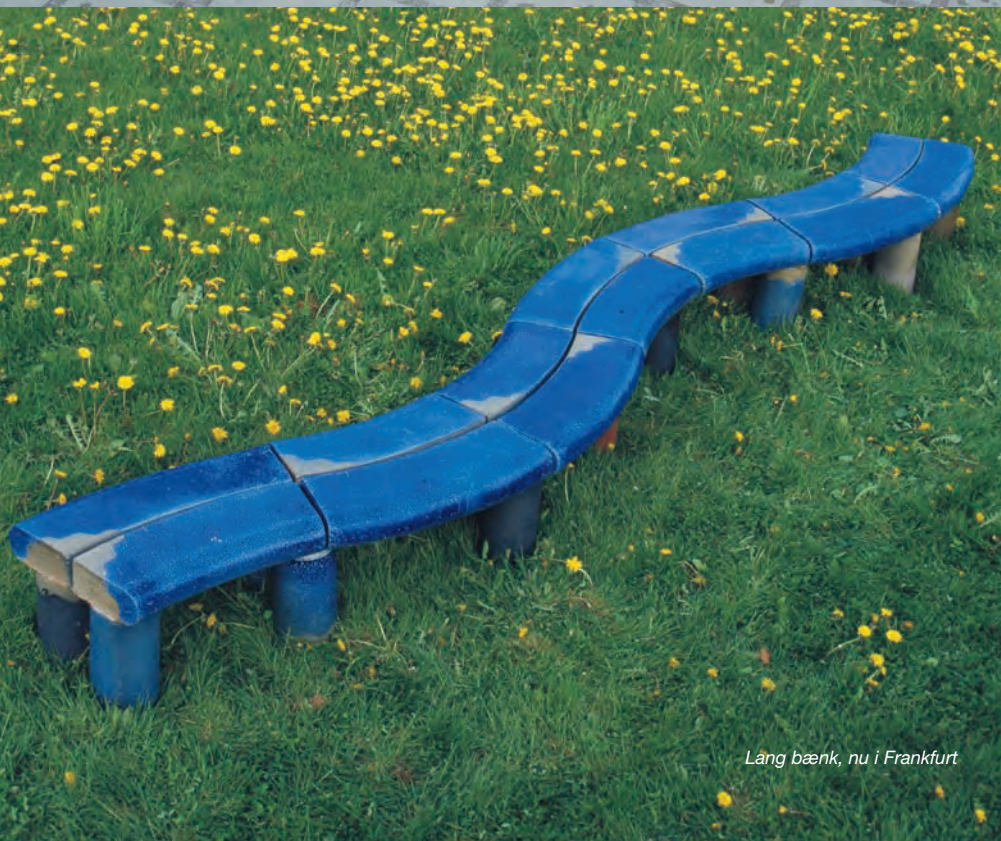
Lång bänk, nu i Frankfurt