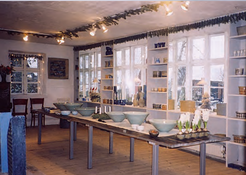
Sommer, vinter og julestue i Fulby