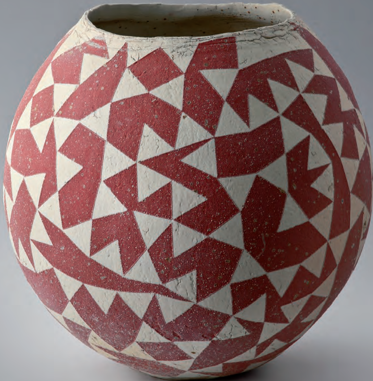
Krukke h. 40 cm