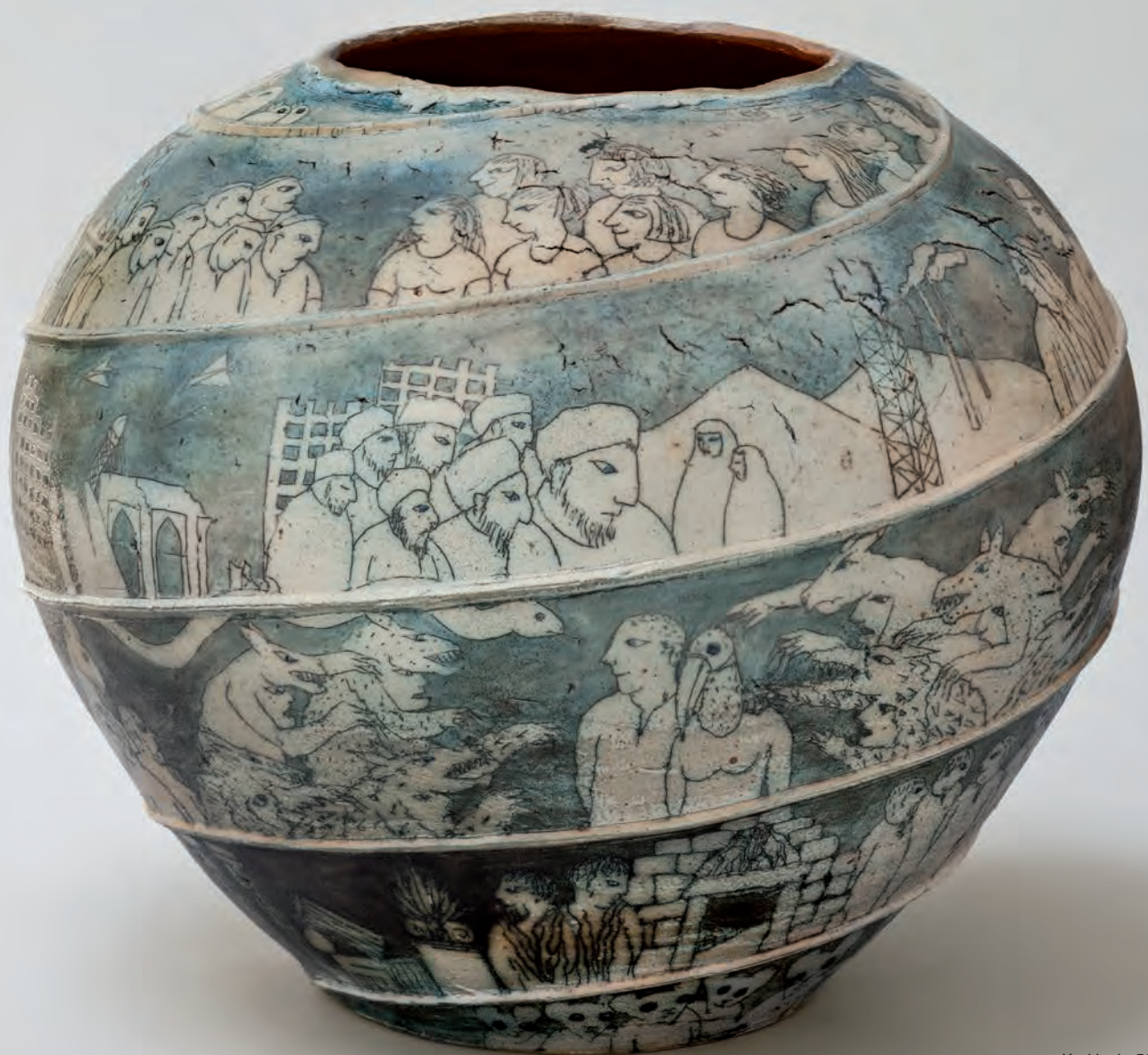
Krukke h. 50 cm