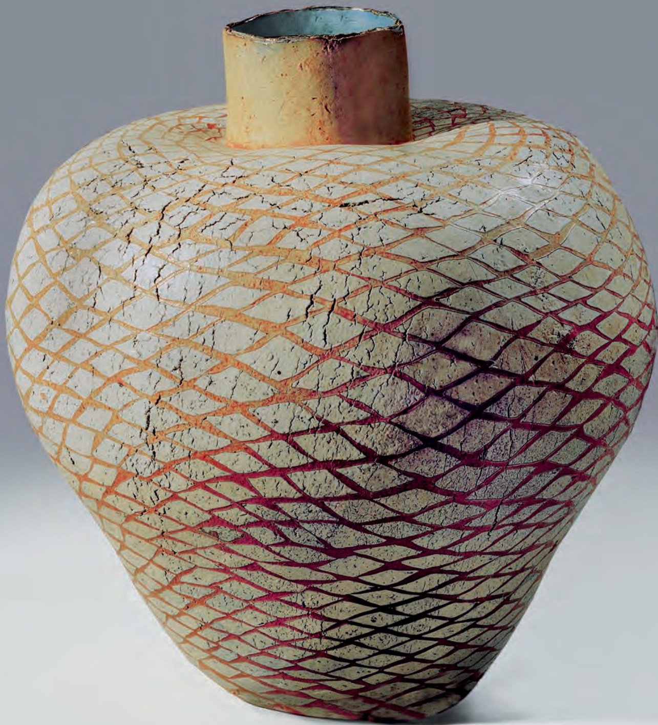
Krukke h. 60 cm. Nationalmuseet i Stockholm