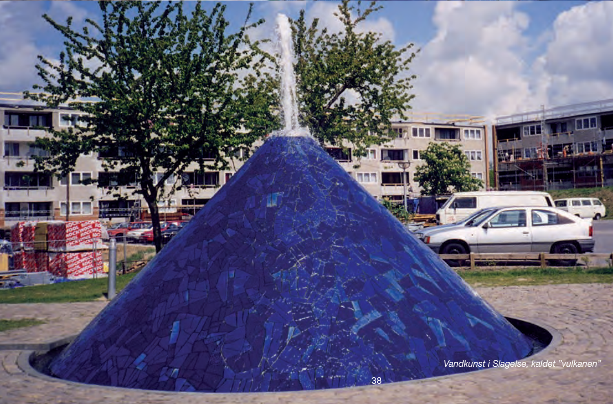
Vandkunst i Slagelse, kaldet "vulkanen"