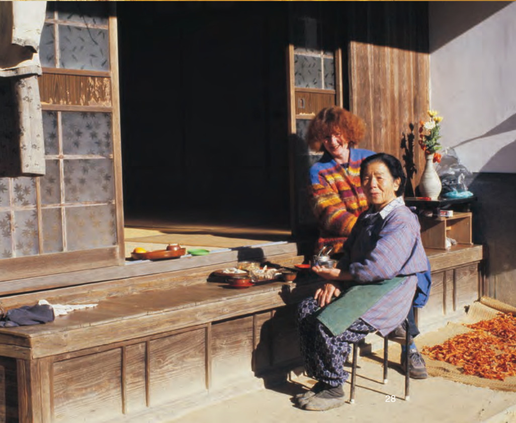
Rejse til Japan. Soltørring af ler på øen Kiushu og morgenthe hos nabo