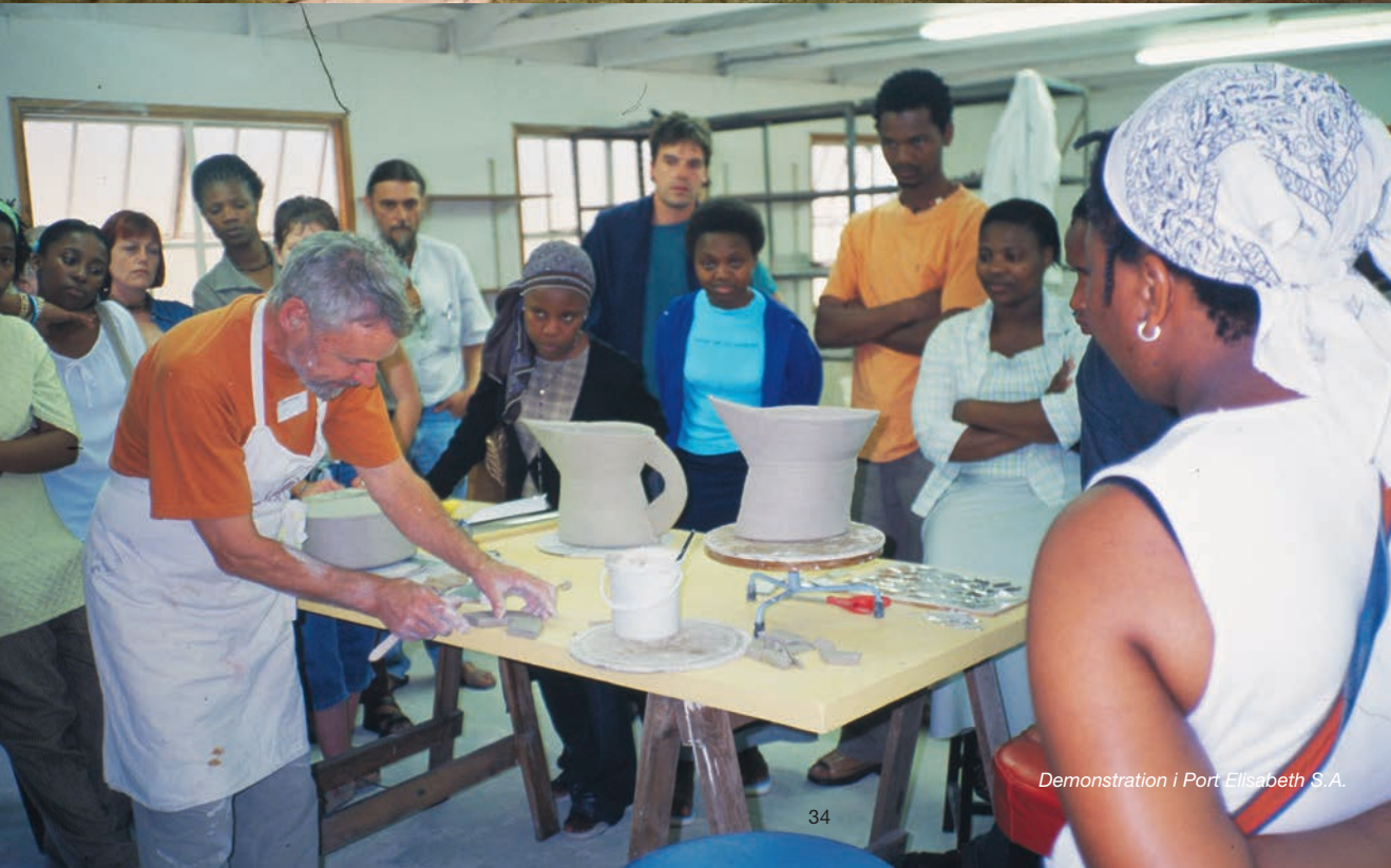
Demonstration i Port Elisabeth S.A.