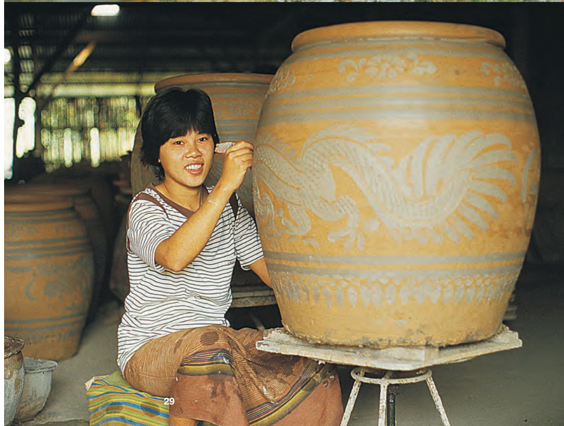
Rejse til Thailand. Traditionelle vandkrukker i byen Ratchaburi