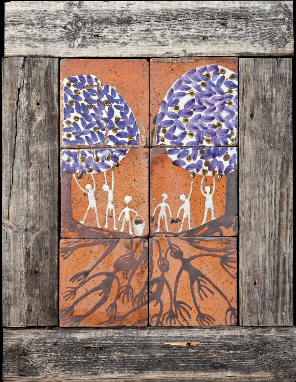
Birgittes relief Apartheid