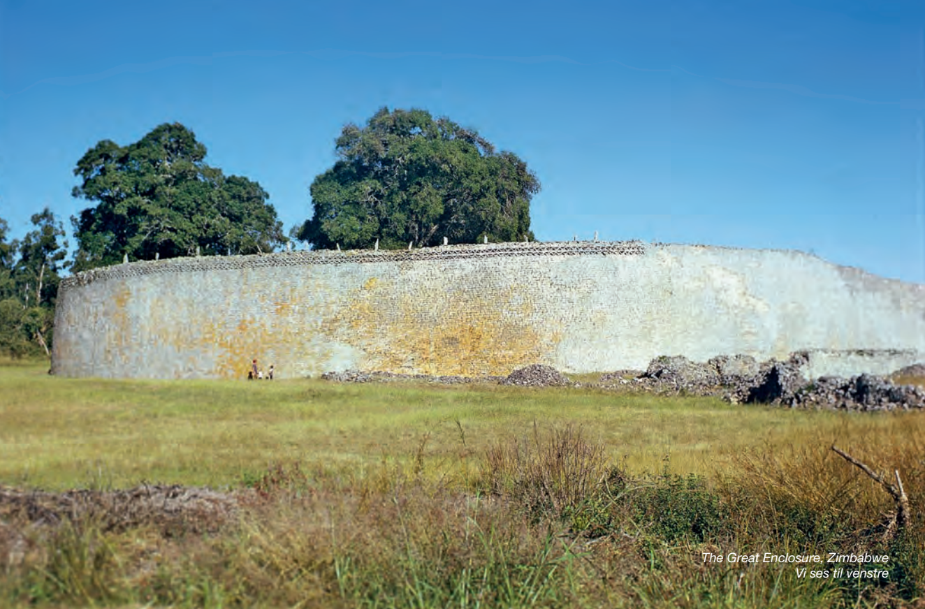
The Great Enclosure, Zimbabwe Vi ses til venstre