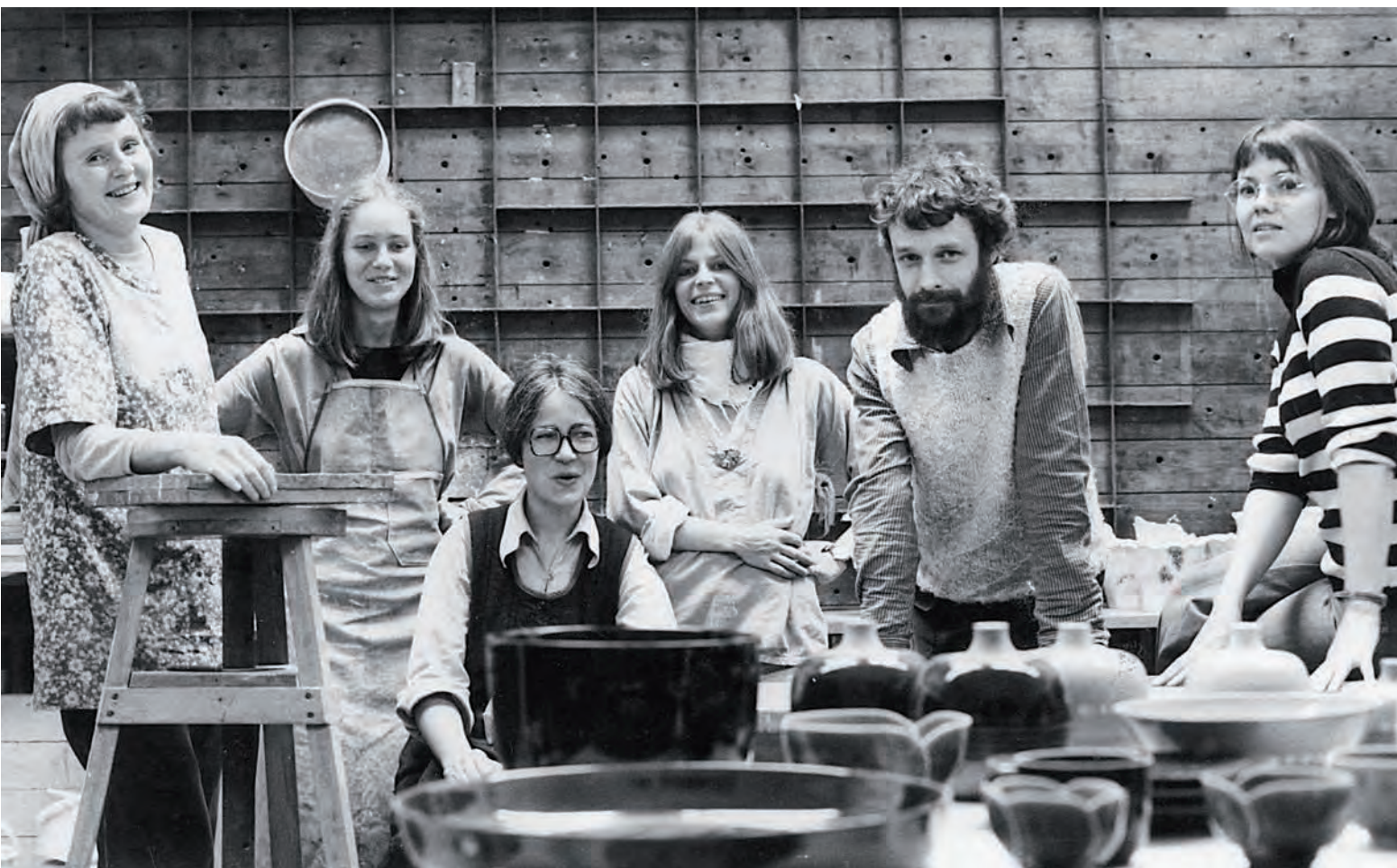
Projekt 75 – 6 unge keramikere udvikler nye ideer på Den kgl. Porcelænsfabrik