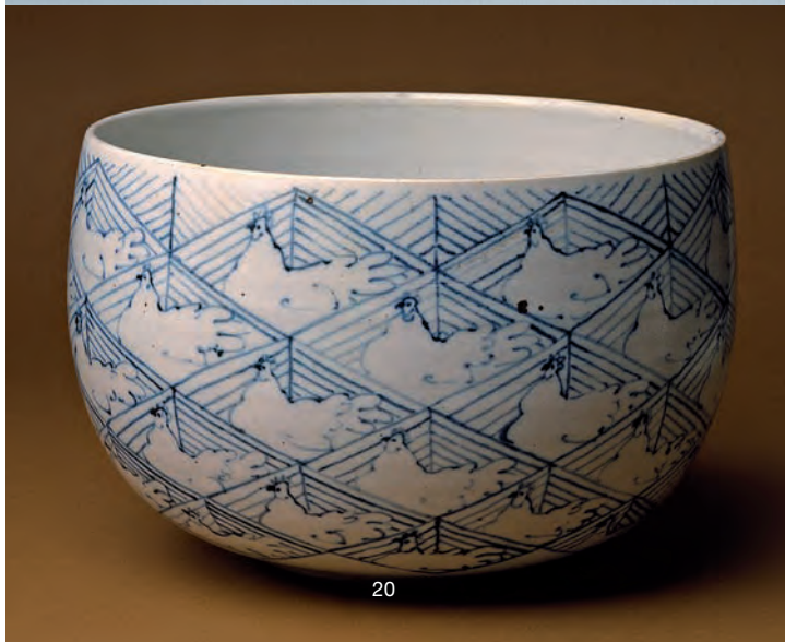
Vi arbejder med porcelæn lige fra dukkehoveder, snapseglass til skål med burhøns