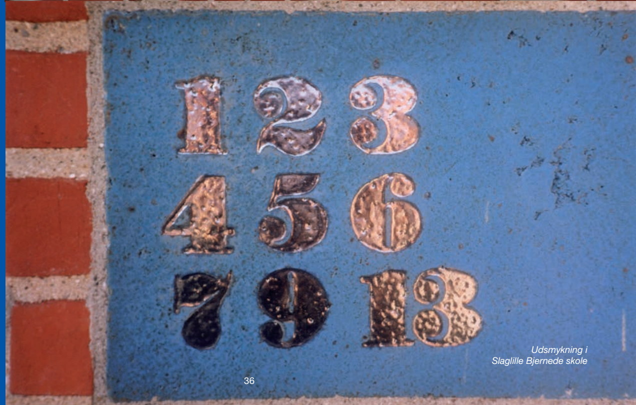
Udsmykning i Slaglille Bjernede skole