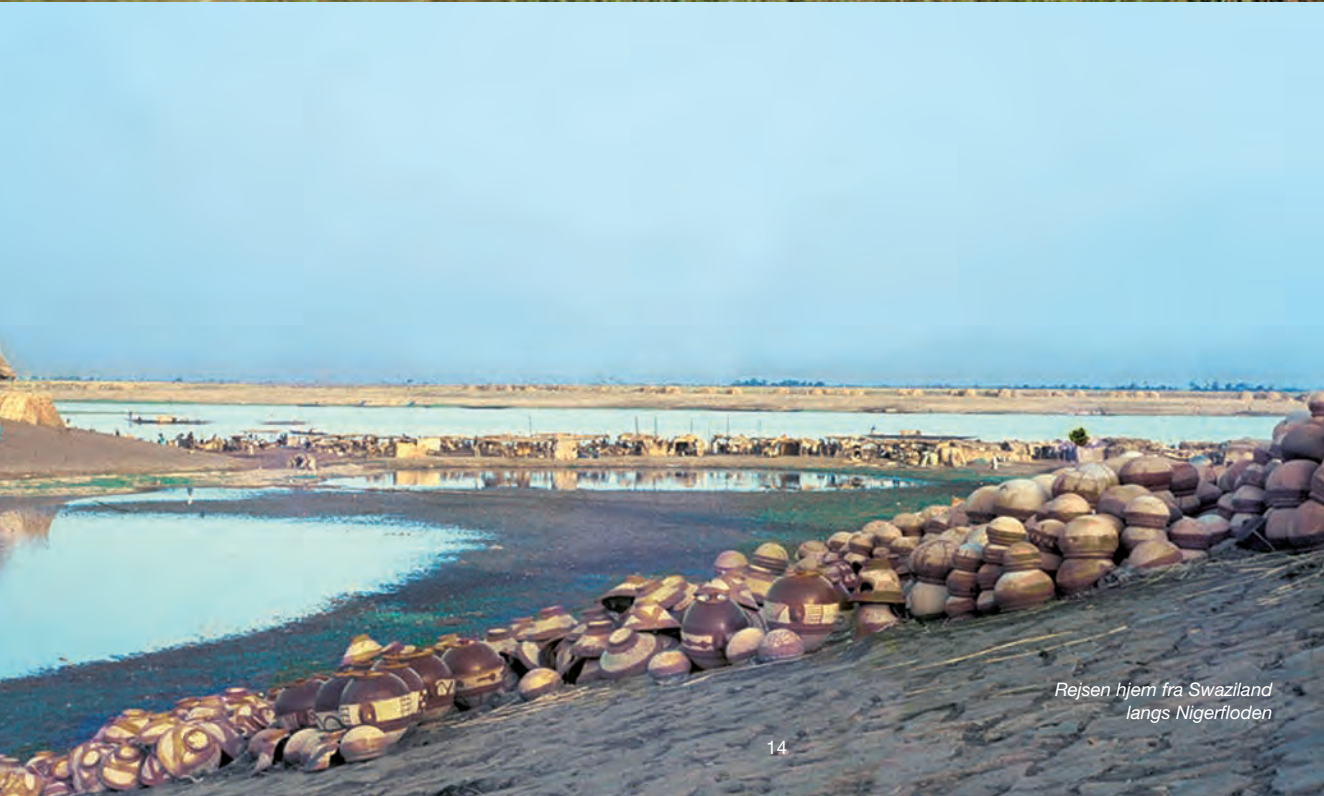
Rejsen hjem fra Swaziland langs Nigerfloden