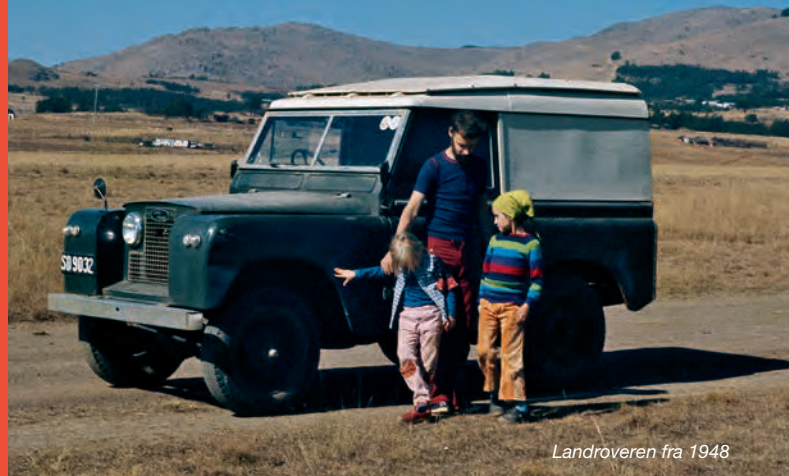
Landroveren fra 1948