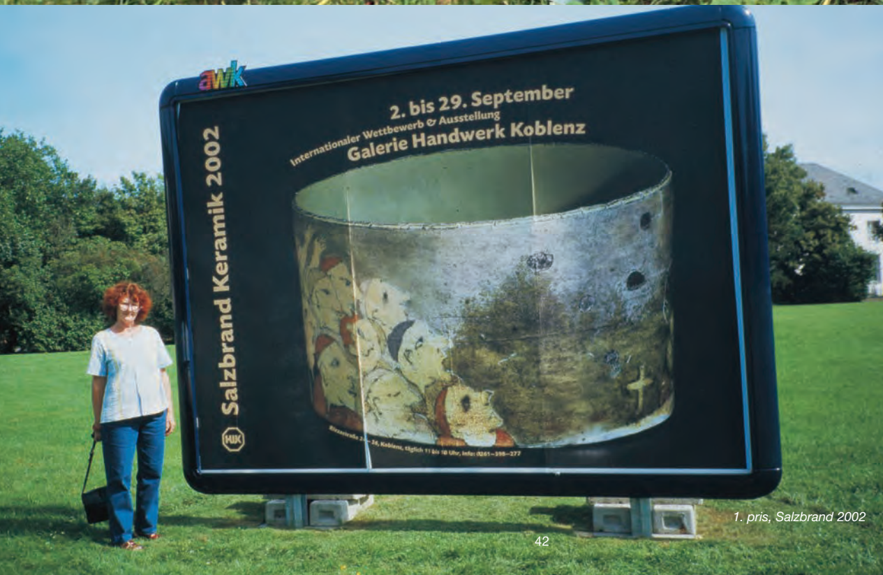
1. pris, Salzbrand 2002