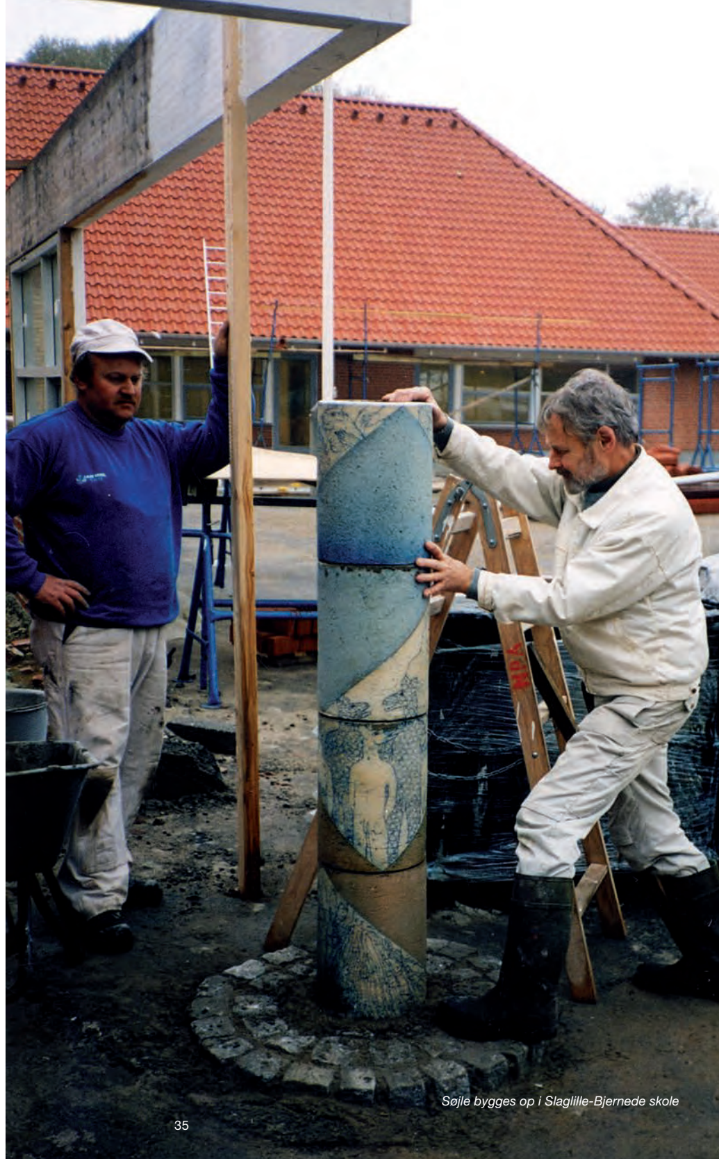
Søjle bygges op i Slaglille-Bjernede skole