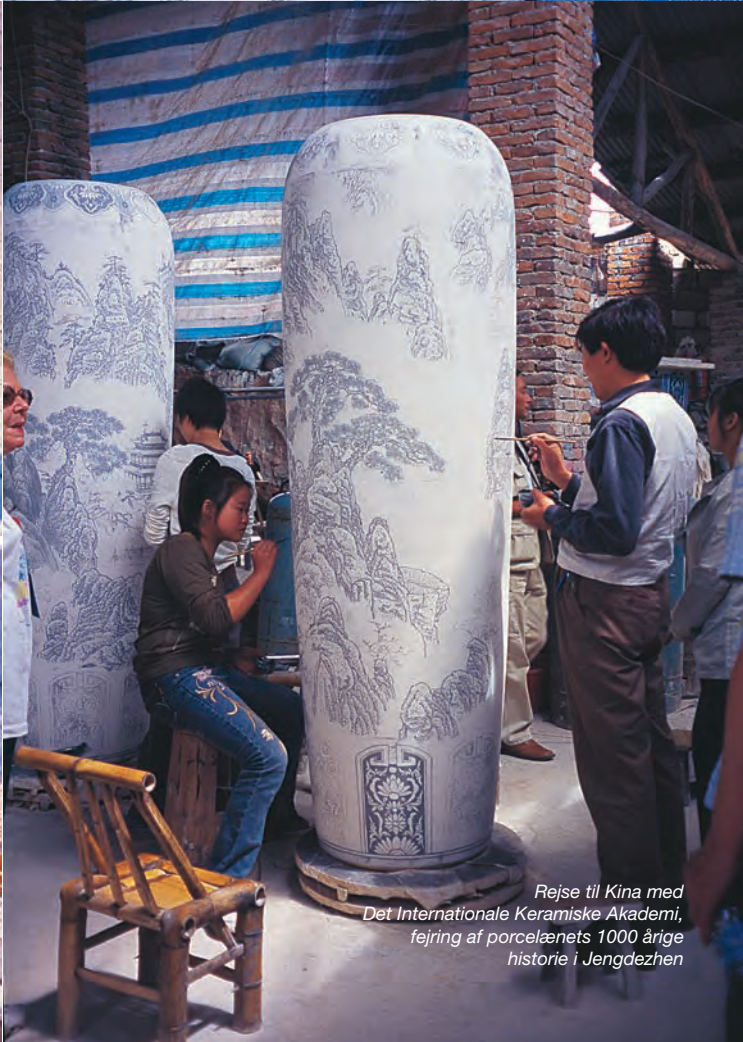
Rejse til Kina med Det Internationale Keramiske Akademi, fejring af porcelænets 1000 årige historie i Jengdezhen