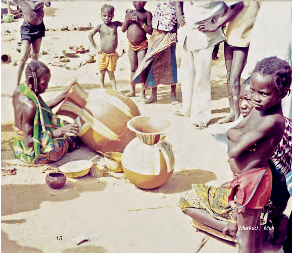
Marked i Mali