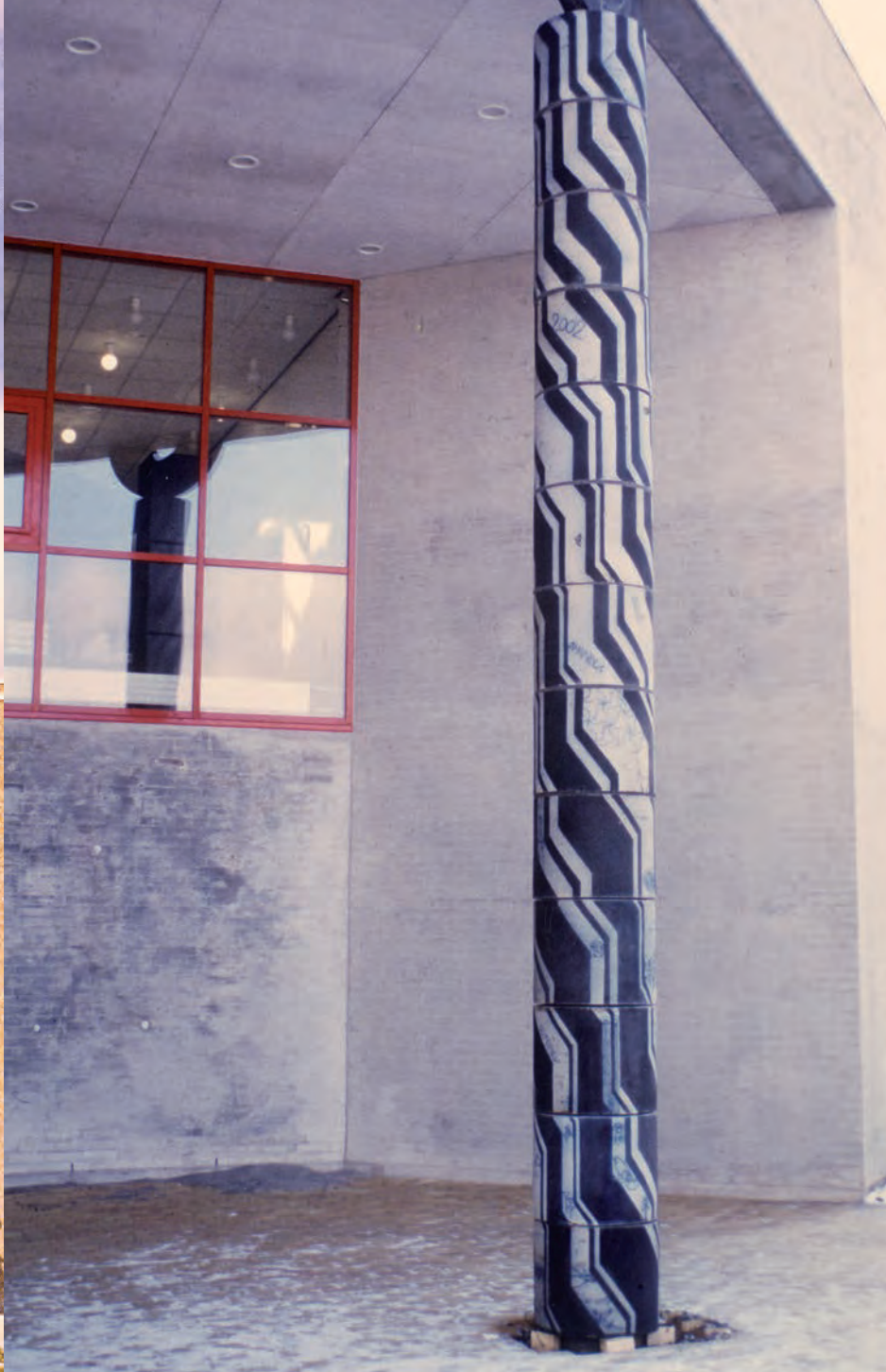
Søjler i Sæby og Vordingborg 8 m høje