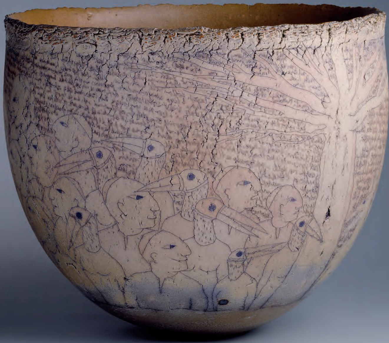
Skål d.55 cm